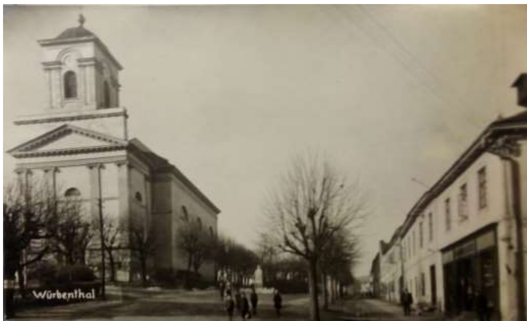
Vrbenský římskokatolický kostel Sv. Michaela Archanděla okolo roku 1930

Více o attributech jednotlivých světců se dozvíte třeba tady: http://katolicka-kultura.sweb.cz/svetci_hagiografie/svetci_hagiografie.html . Správné odpovědi na otázky můžete hledat také na Wikipedii a v klasických encyklopediích v knihovně. ☺