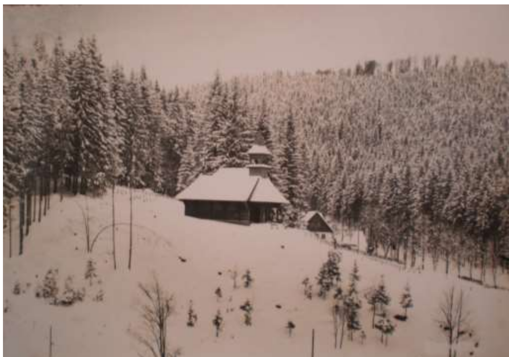
Kaplička Sv. Hedviky ve Vidlích u Vrbna pod Pradědem okolo roku 1930